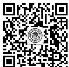
山西师范大学官方微信公众